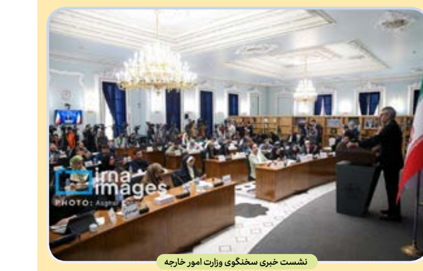
نشست خبری سخنگوی وزارت امور خارجه