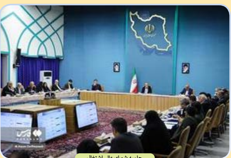
جلسه شورای عالی اشتغال