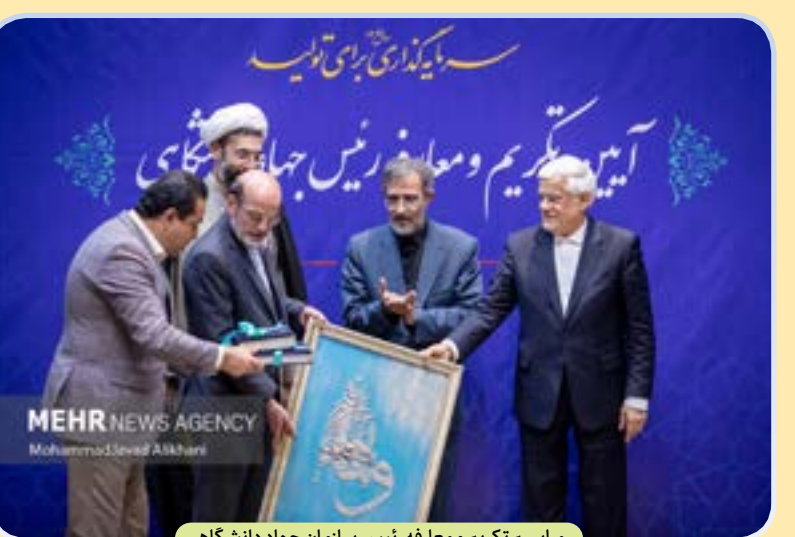
مراسم تکریم و معارفه رئیس سازمان جهاد دانشگاهی