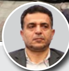
نماینده مردم همدان در مجلس:

افزایش ۵۰ درصدی ظرفیت فعال اتوبوس در همدان بانک کشاورزی در خریداری اتوبوس‌ها ویژه عمل کرده است