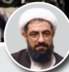
نماینده ولی فقیه در استان همدان:

باین شرایط سخت اقتصادی، خرید اتوبوس از سوی شهرداری جای تشکر دارد از آقای شهردار و اعضای شورا قدردانی می‌کنم که به موضوع ترافیک پرداختند