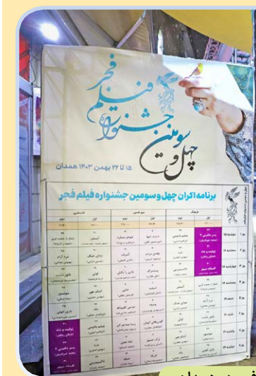
حال و هوای جشنواره فیلم فجر در همدان