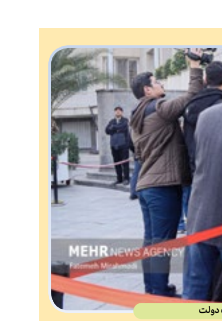
حاشیه جلسه هیأت دولت

نشریه ویژوال کاپیتالیزت در گزارشی به بررسی وضعیت رسیدگی و سرعت عمل بخش اورژانس بیمارستان‌های ایالات متحده پرداخته است. بر اساس این گزارش بیماران در پایتخت ایالات متحده بیشترین معطلی را با صرف زمان میانگین ۵ ساعت و ۱۴ دقیقه دارند و کمترین معطلی بیماران در بخش اورژانس، در ایالت داکوتای شمالی با ۱ ساعت و ۵۰ دقیقه است.