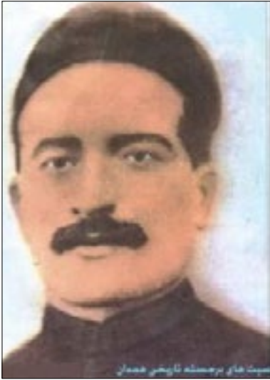
بیت های برمنسته فارسی همدانی

هگمتانه، گروه کتاب؛ دیوان مفتون یک سخن منظوم کامل فارسی است زیرا انواع شعر پارسی از غزل، قصیده، مثنوی و… کلاً در دیوان وجود دارند، اشعار در بحر مختلف و صنایع شعری دیده می‌شوند و شاعر با قدرت و استادی از عهده کار برآمده است.