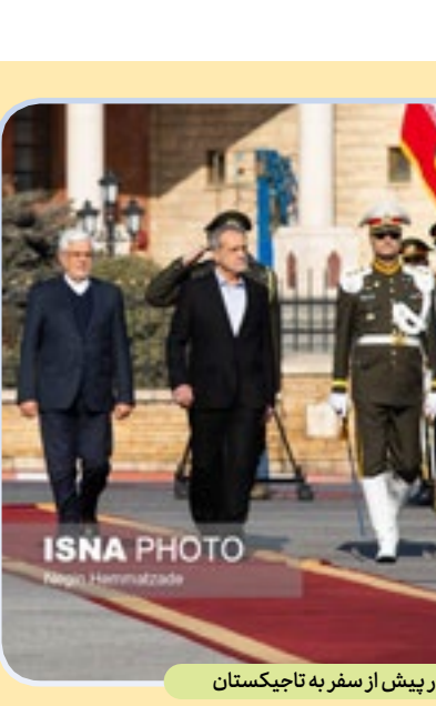
مراسم بدرقه رئیس‌جمهور پیش از سفر به تاجیکستان