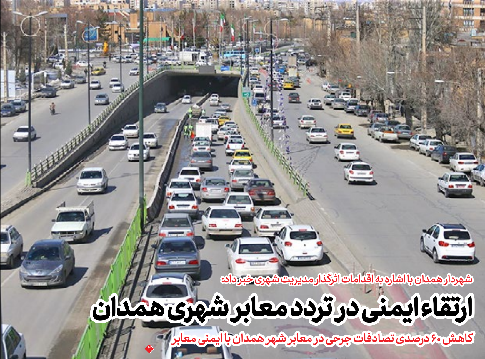
شهردار همدان با اشاره به اقدامات اثرگذار مدیریت شهری خبر داد:

کلنگ‌زنی ۶۴ واحد مسکن محرومان در کوی تفریجان