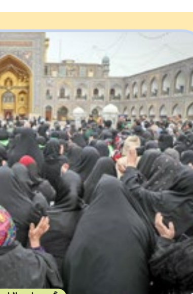
گردهمایی زائران زیارت اولی کشور