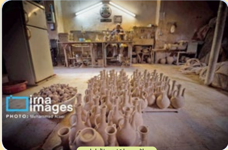
«لالچین» پایتخت سفال ایران