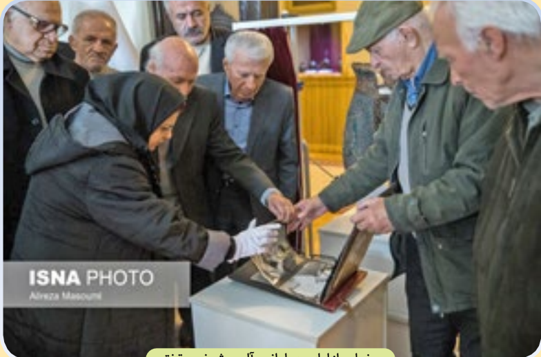
رونمایی از لباس پهلوانی و آلبوم شخصی تختی