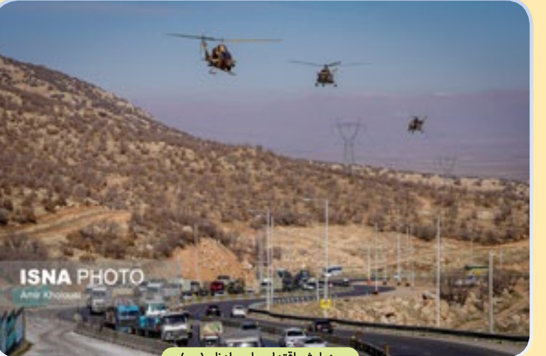
رزمایش اقتدار پیامبر اعظم (ص)