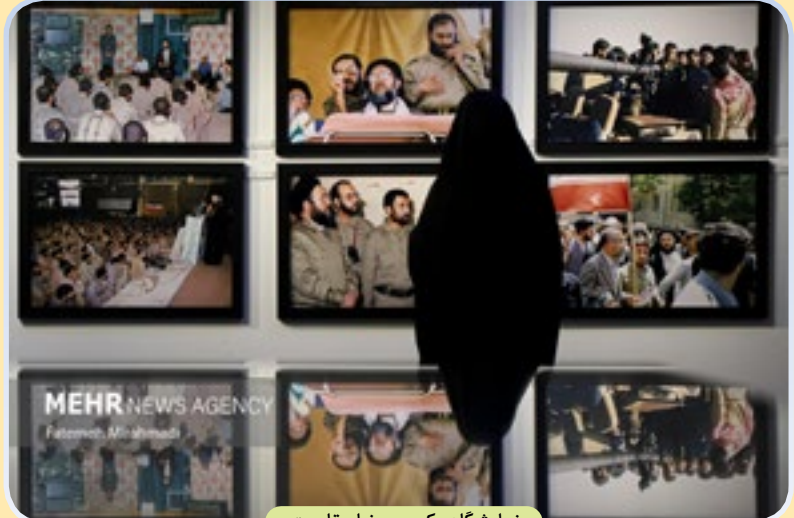
نمایشگاه عکس «برخط مقاومت»