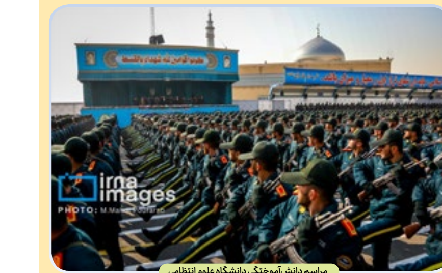
مراسم دانش‌موختگی دانشگاه علوم نظامی