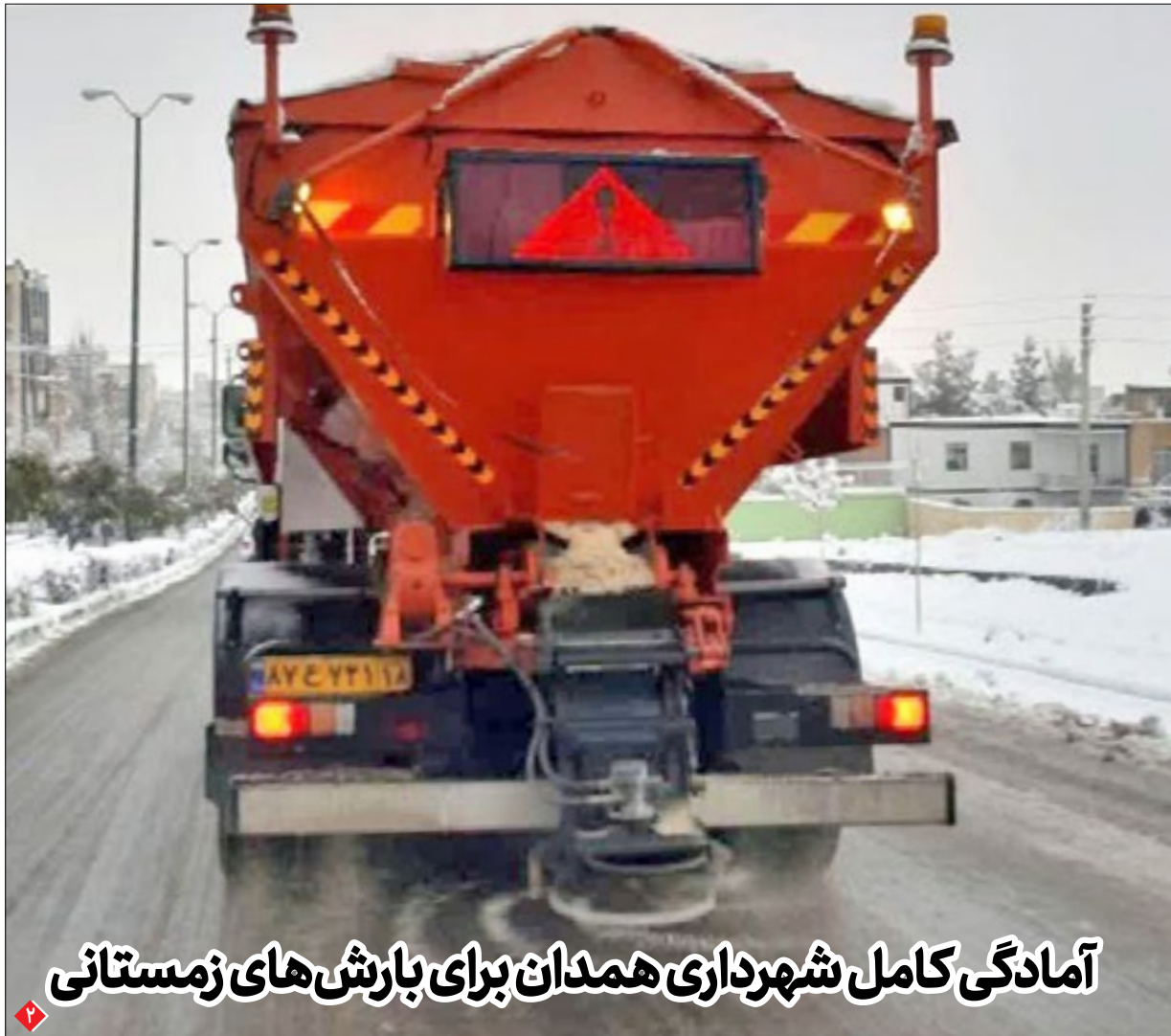
آمادگی کامل شهرداری همدان برای بارش‌های زمستانی