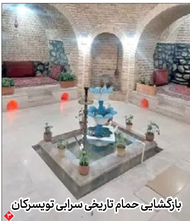
بازگشایی حمام تاریخی سرابی تویسرکان

ارتباط تجاری شرکت‌های ایرانی و خارجی بزرگ‌ترین نیاز بازار صنعت مبلمان