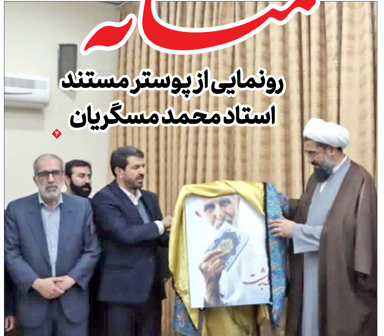
رونمایی از پوستر مستند استاد محمد مسگریان