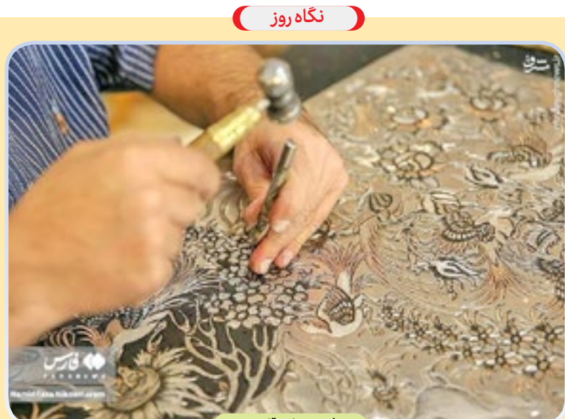
ثبت جهانی قلم‌زنی