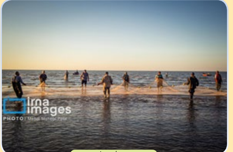
صید ماهی در خزر