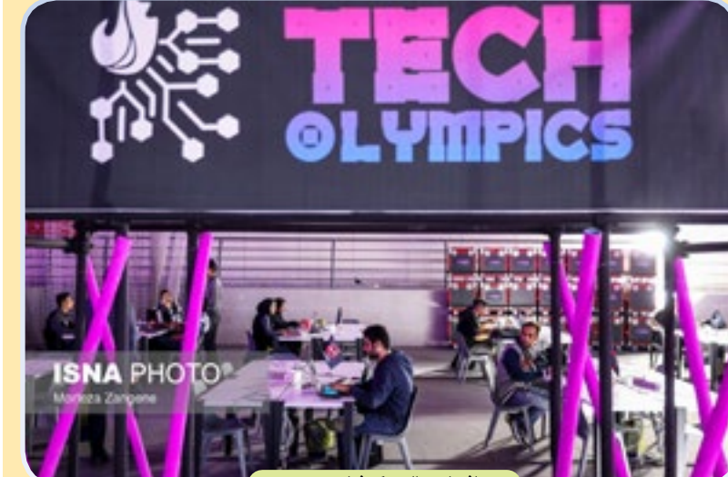
افتتاحیه المپیک فناوری ۲۰۲۴