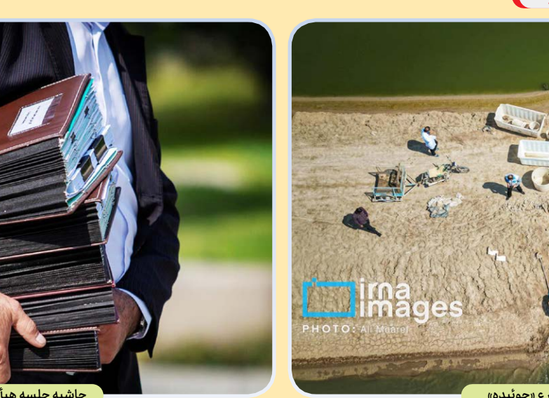
پرداخت میگو از مزارع «چونبده»

رئیس سازمان بازرسی کل کشور درباره پاداش‌های پرداخت شده بابت جام جهانی قطر گفت: پاداش پرداخت شده به اعضای هیأت رئیسه فدراسیون فوتبال بابت مسابقات جام جهانی قطر پیگیری شد. خداییان ادامه داد: بازیکن و کادرفنی پاداش می‌گیرد اما اینگونه نیست هر مدیری که همراه تیم است، پاداش بگیرد. با پیگیری صورت گرفته این مبلغ