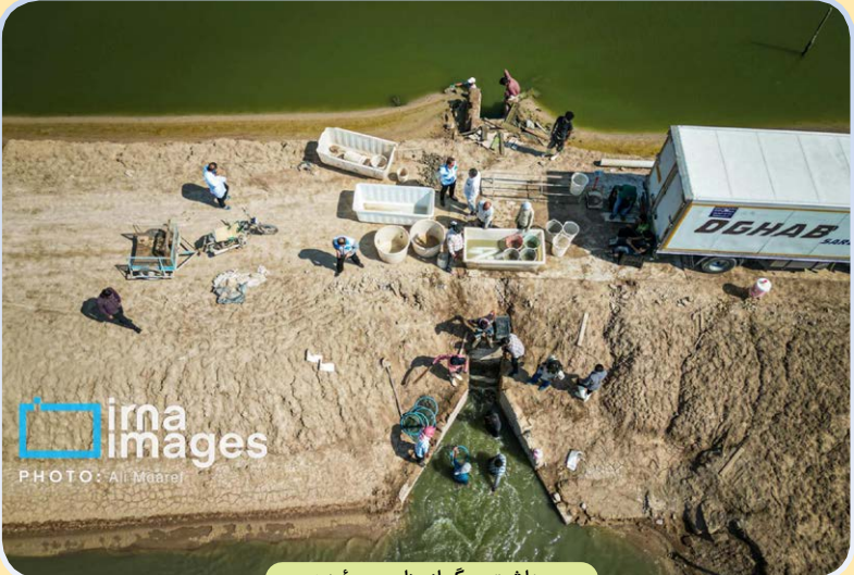
پرداخت میگو از مزارع «چونبده»