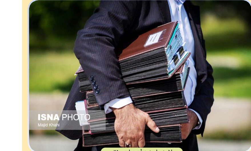
حاشیه جلسه هیات دولت - ۲۵ مهر

واقعا آنچه که می‌جنگد و مبارزه می‌کند، روح است؛ این روح متصل به الله (سبحانه و تعالی) است.