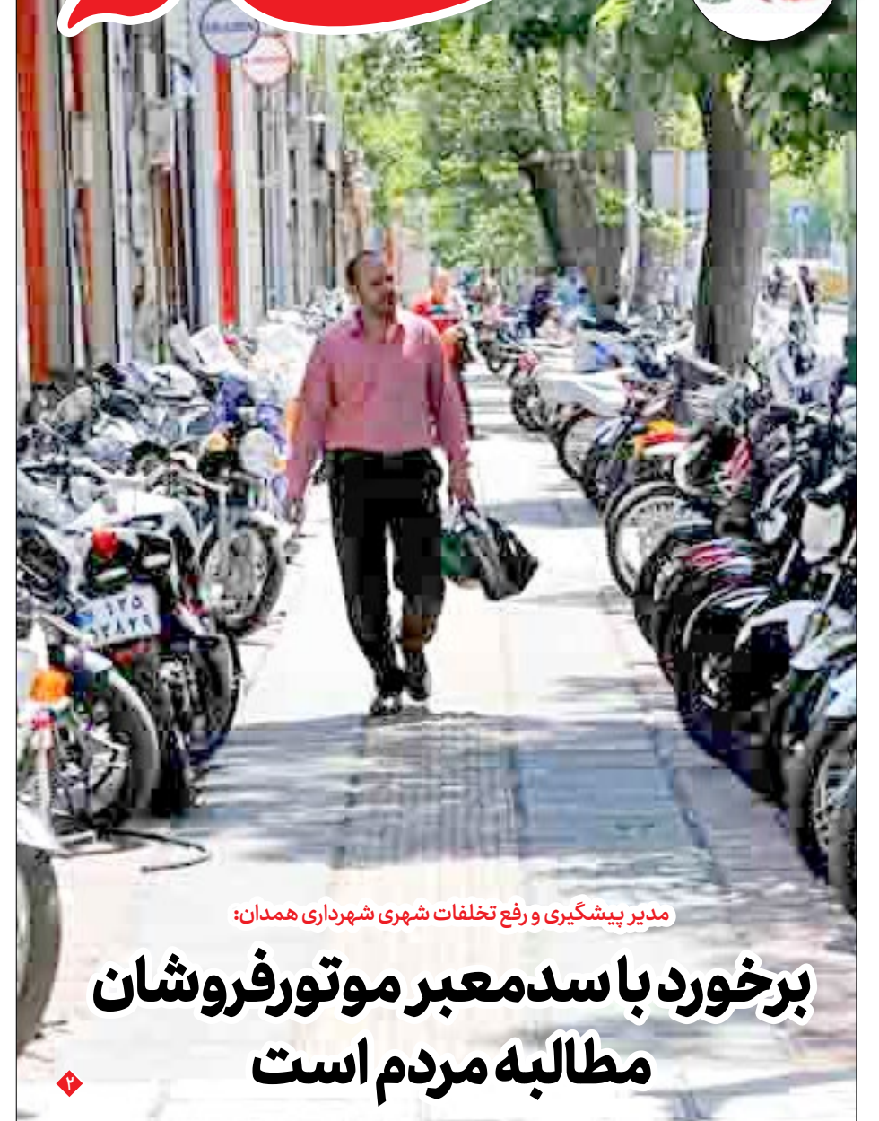
مدیر پیشگیری و رفع تخلفات شهری شهرداری همدان:

فرماندار همدان: پیگیری‌ها برای ایجاد شهرک سیر