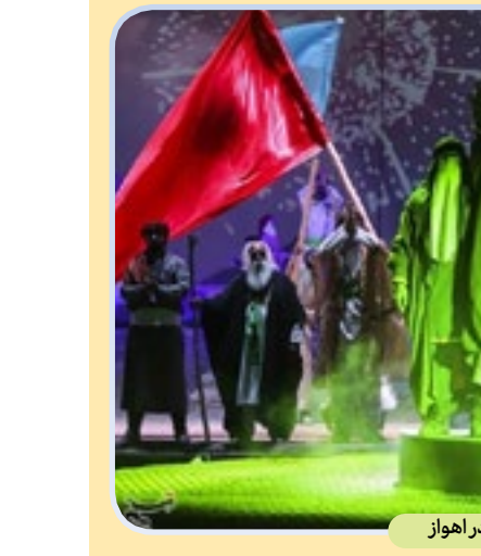
نمایش حکم ولایت در اهواز