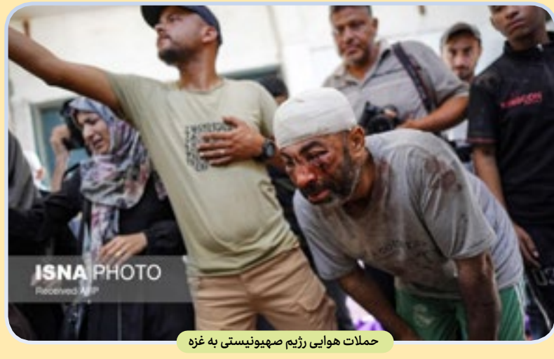
حملات هوایی رژیم صهیونیستی به غزه