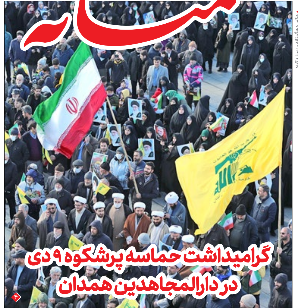
گرامیداشت حماسه پرشکوه ۹ دی در دارالمجاهدین همدان