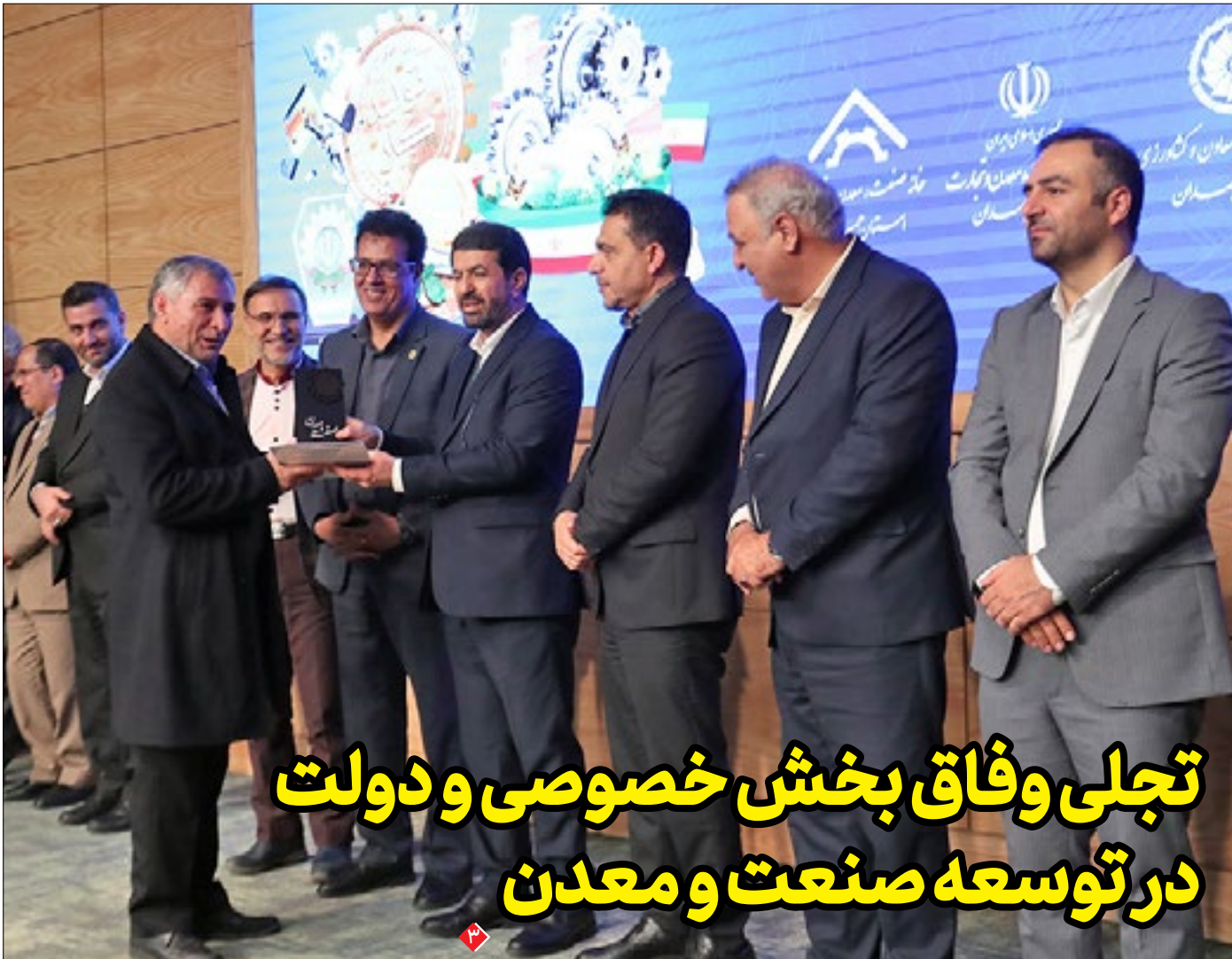
تجلی وفاق بخش خصوصی و دولت در توسعه صنعت و معدن