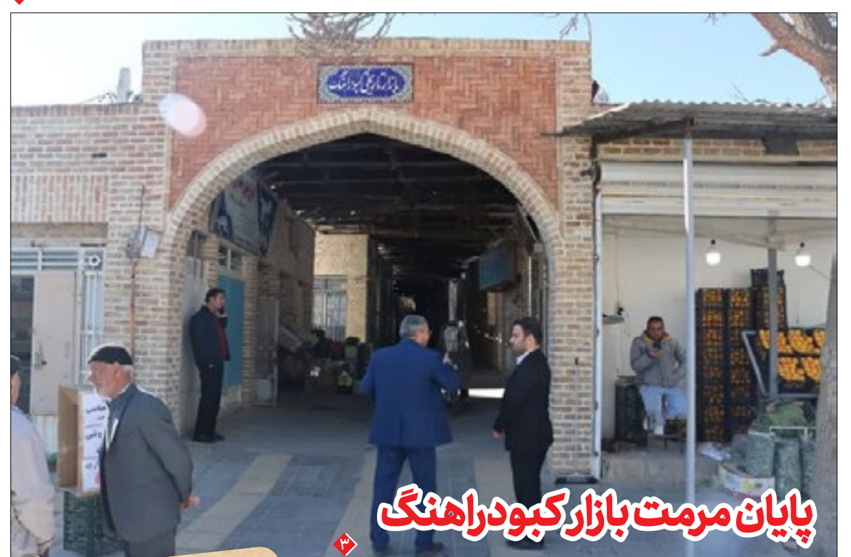
پایان مرمت بازار کبودراهنگ

دلایل ناکامی از زبان مربیان در گفت و گو با هگمتانه